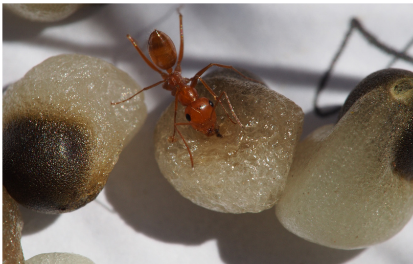
נוטת כתומה אוכלת זרע של אליוזום במעלה רחבעם